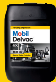
Mobil Delvac MX 15W-40

Высококачественное минеральное масло для дизельных двигателей