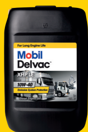
Mobil Delvac XHP LE 10W-40

Синтетическое моторное масло для дизельных двигателей, применяемое в моторах, оснащенных фильтрами твердых частиц (DPF)