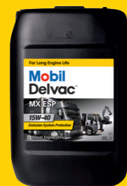
Mobil Delvac MX ESP 15W-40

Полусинтетическое моторное масло для дизельных двигателей, применяемое в моторах, оснащенных фильтрами твердых частиц (DPF), имеющее низкий уровень зольности. Создано с применением новейшей технологии очистки минеральных базовых масел и высококачественной системы присадок